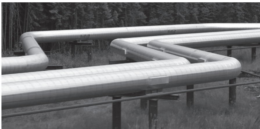
Une partie de l'hydrogénoduc en construction entre Barcelone et la France.

Pour ce qui est des infrastructures de mobilité : plus de 736 projets de déploiement de bus à l'hydrogène, et donc de stations de recharge, sont en cours en France, dont un tiers est déjà réalisé ou en construction. Plusieurs entreprises logistiques ont installé sur leurs plateformes des stations de recharge pour les camions roulant à l'hydrogène.